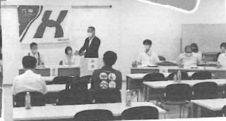
6/19 九電ユニオン分会大会