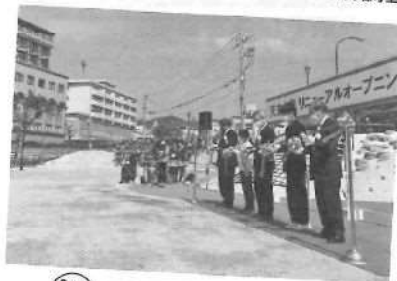
3/24 天主公園リニューアル