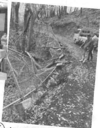
3/29 小ヶ倉地区道路崩壊箇所調査