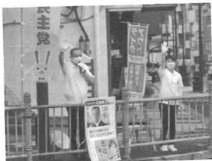
1/5 県政報告街頭演説

窮屈なスケジュールとなりますが、各委員の提言を取りまとめ、実効性のある政策提言ができるよう、委員長として取り組む覚悟です。