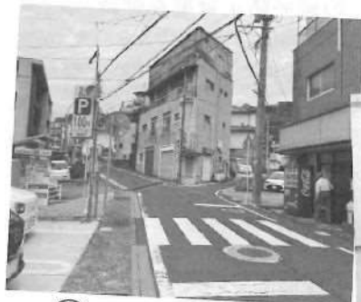
4/3 高尾町交差点調査