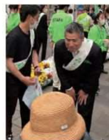
写真：緑の募金活動