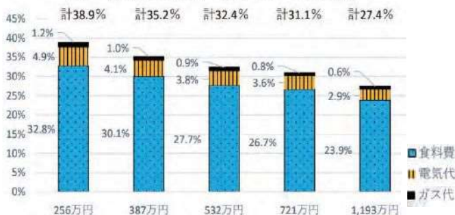
図2 収入に占める食料・電気・ガスへの消費割合