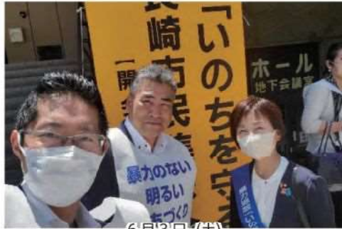
6月3日(土) 「命を守る」長崎市民集会