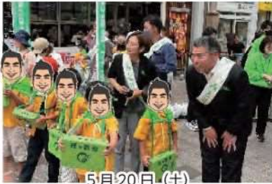
5月20日(土) 緑の募金活動