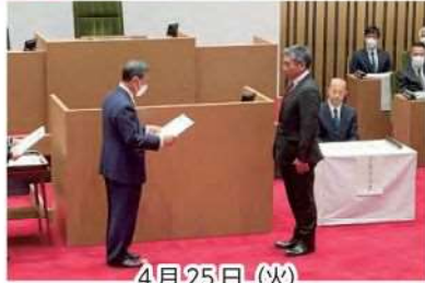
4月25日(火) 当選証書授与式