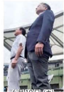
6月10日(土) 中総体開会式