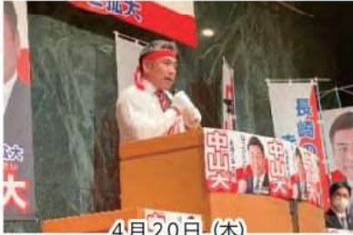
4月20日(木) 総決起集会