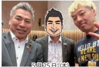
5月25日(木) 長崎ヴェルカ B1 昇格報告会