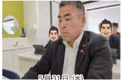
5月31日(水) 新人議員研修会