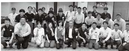
8/21 九電工労組報告会