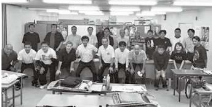
7/27 長崎バス労組中央委員会