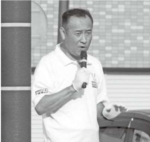
浦上天主堂前街頭演説にて