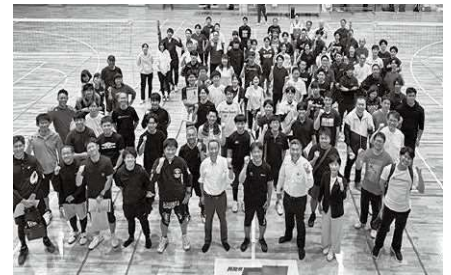
10/5 ソフトバレーボール大会