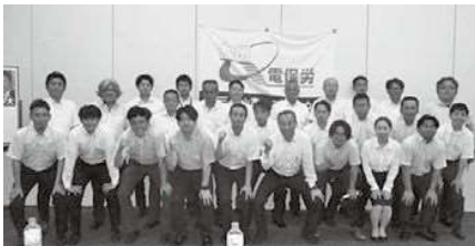
8/6 九州電保労政治報告会