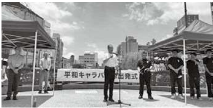
8/3 平和キャラバン出発式