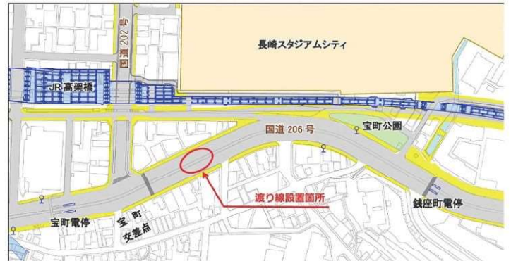
■渡り線設置平面図