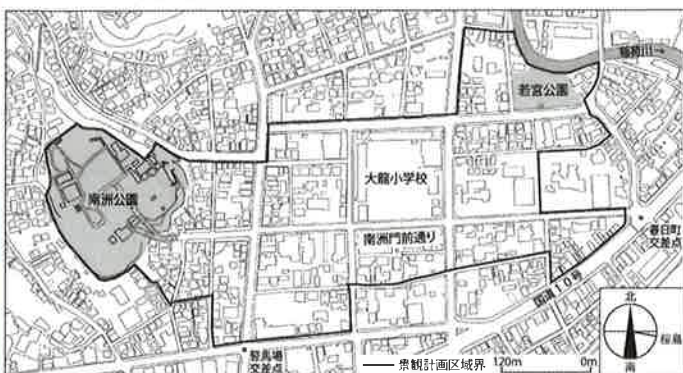
南洲門前通り地区景観計画区域図